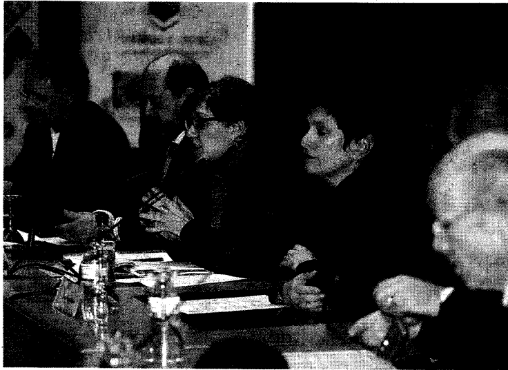
Los ponentes de la primera charla de «Encuentros Averroes», ayer, en la conferencia