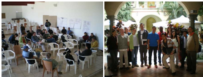
Talleres de trabajo y equipo del COMET-LA desplazado a México

La concienciación sobre la necesidad de preservar los recursos naturales y evitar la tala indiscriminada del bosque llevó a la comunidad a presionar en los años 80 al gobierno mexicano para que revocara la concesión dada a la papelera que actuaba en la zona, cosa que lograron y a partir de entonces crearon su propia unidad de aprovechamiento forestal. Esta empresa comunitaria es la encargada de trabajar los recursos forestales de un modo sostenible, que alcanza los estándares internacionales establecidos por el Forest Stewardship Council con sede en Bonn, Alemania y con un esquema de reforestación de las zonas aprovechadas, de modo que el bosque permite obtener beneficios para la comunidad respetando el ecosistema para que sea un modo de vida sostenible. Además, parte de las ganancias que obtiene la empresa se reinvierten en servicios sociales comunales, como la escuela, el centro de salud o la rehabilitación de la iglesia y caminos del pueblo.