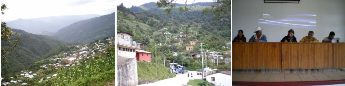
Imágenes de Comaltepec y firma del compromiso del proyecto con las autoridades locales

El equipo del proyecto "Gestión comunitaria de los desafíos ambientales en Latinoamérica" (COMET-LA), del que forma parte el CeUICN, visitó recientemente la comunidad de Comaltepec, ubicada en la Sierra Norte de Oaxaca, México, para llevar a cabo una serie de talleres participativos con la población.