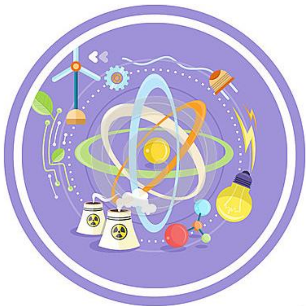
La Física encuentra soluciones para un mundo mejor

La Física es clave en el desarrollo humano por ser, no solamente la ciencia capaz de explicar cuestiones básicas relacionadas con el origen del universo y de la materia, sino también por ser, en la actualidad, uno de los motores de la innovación tecnológica (materiales, fuentes de energía, comunicaciones, nuevos dispositivos, etc.).