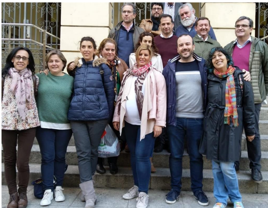
Algunas personas de las candidaturas de PDI Laboral y PDI Funcionario