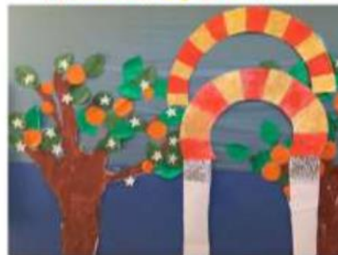
Ceip Luis de Góngora