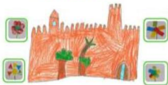
CEIP SANTOS MÁRTIRES