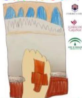
CEIP PABLO GARCÍA BAENA