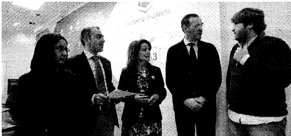
Asistentes a la presentación del premio, ayer en el Rectorado de la UCO.