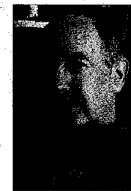
Rafael Yuste.

Nobel Sydney Brenner y Torsten Wiesel. En su tesis, descubrió cómo utilizar métodos de imagen de calcio para registrar la actividad de varios centenares de neuronas. El gran objetivo ahora es poder hacerlo en tres dimensiones y medir la actividad de cada vez más células.