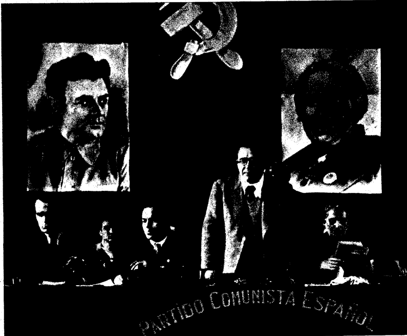
Santiago Carrillo, de pie, entre Enrique Lister, Francisco Antón y Dolores Ibárruri, en Toulouse en 1945.

Tras 17 meses en la cárcel a raíz del fracaso de la huelga de ese año, Carrillo viajó a Rusia. Le deslumbró. "Tuvo la sensación de que el PSOE era un partido del pasado", escribe Preston. Ya estaba en la pista de despegue hacia el comunismo. A la vuelta comienza la guerra. Carrillo formaliza su ingreso en el PCE al tiempo que se desarrollan los sucesos de Paracuellos, el episodio que le perse-