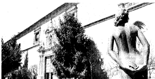
Vista de la fachada del Rectorado de Granada, en el Hospital Real que acaba de cumplir 500 años.