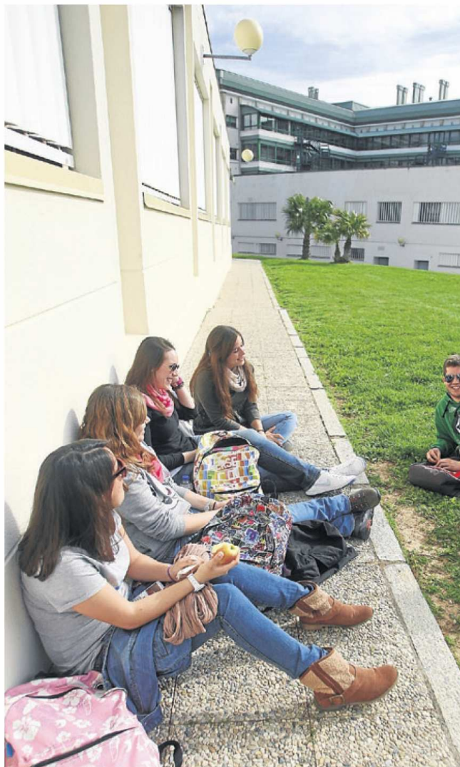
► Los estudiantes tienen a su disposición un amplio abanico de servicios.

En el propio Aulario hay una zona donde están situados varios servicios: dos oficinas bancarias, tres establecimientos de