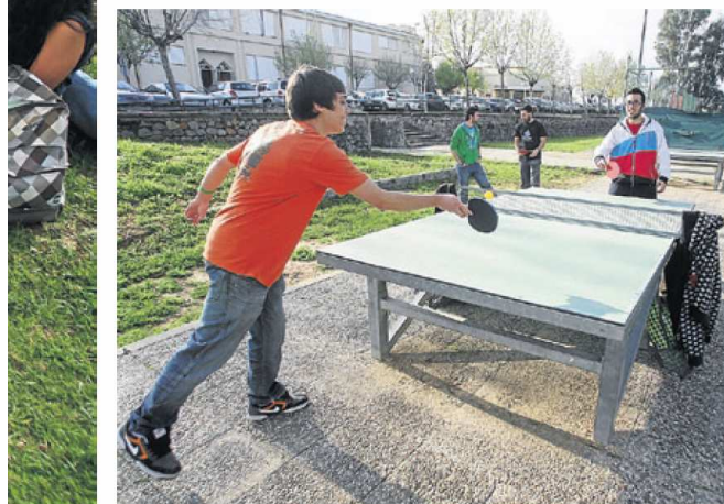
► Cuenta con instalaciones deportivas gratuitas.

Reprografía y Copistería, un aula de Ucoidiomas para que los alumnos que visitan a diario el campus cursen, completen o perfeccionen idiomas. También hay situaciones dos oficinas de orientación, la de Fundecor y la correspondiente al Consejo Social.