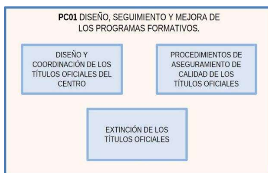
Figura 3. Actividades del PC01.

Este procedimiento incluye, al menos, las actuaciones del centro relacionadas con las actividades del diseño y coordinación de los títulos oficiales, con procedimientos de aseguramiento de calidad de los títulos oficiales y con el proceso para la extinción de los títulos oficiales (Figura 3).