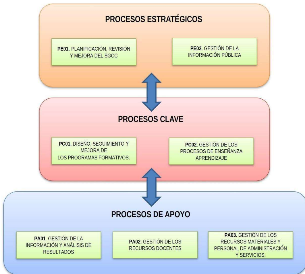
Figura 2. Mapa de Procesos del SGCC de la UCO.

Para cada uno de estos procesos se han definido una serie de procedimientos comunes para todos los centros. En el apartado 3.6 de este manual se describe la finalidad de cada uno de los procedimientos. Asimismo, para algunos de estos procedimientos, se definen las actividades que necesariamente deben desarrollar los centros, sin perjuicio de que se incluyan otras específicas atendiendo a las singularidades de cada centro y, vinculándose a algunos de los procedimientos que se describen a continuación: