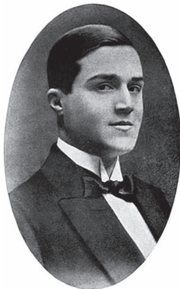
Fig. 1. Autorretrato de Retana aparecido en Historia del arte frívolo , 1964.

Esta etopeya rojiverde, que da buena cuenta del carácter multidisciplinar del artista, viene motivada por la contemplación desde la senectud de un autorretrato [Fig. 1] de sus inicios literarios en El Heraldo de Madrid , cuando contaba con 21 años de edad –o 13– si atendemos a las biografías falseadas incluidas en la contraportada de algunas de sus novelas, que retrasaban a 1898 el año natalicio. Los cuentos galantes y las crónicas subidas de tono que publicaba bajo el heterónimo de la joven francesa Claudina Regnier en revistas y periódicos satíricos como El Gran Bufón , Madrid cómico o La Hoja de Parra y las novelitas que nutrían las, por entonces muy populares, colecciones de narrativa breve, no solo hicieron enrojecer a las mentes más morigeradas, sino que pusieron verdes de envidia a los “Unamunos”, que así llamaba Retana a los escritores más preclaros del 98.