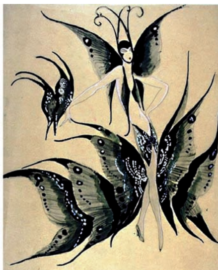
Fig. 8. Figurín de Pepito Zamora.