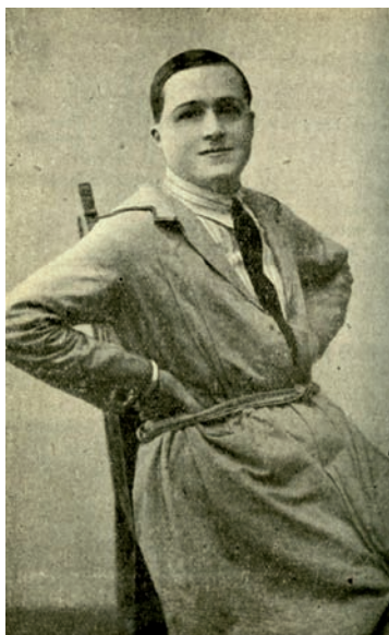
Fig. 6. El novelista más guapo del mundo.

Desde finales de los 80 del pasado siglo XX hasta la actualidad, muchos críticos han tratado de proyectar un haz de luz sobre el autor al que la escritora francesa Myssia Darrys denominó como “el novelista más guapo del mundo” [Fig. 6]. El “epíteto épico” de la ficticia Darrys era uno de sus remoquetes preferidos junto con el de “Petronio español de nuestro tiempo” 21 que le aplicó no una de sus múltiples máscaras, sino el crítico literario Julio Cejador Frauca, que en su Historia de la Lengua y la Literatura Castellanas le apodó de esta manera por ser “el escritor más travieso en asuntos y el más elegante, ameno y delicado en la forma” 22 .