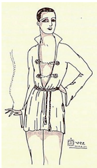
Fig. 9. Dibujo que acompañó a la edición de Las locas de postín prologada por Luis Antonio de Villena, p 89.

“No vivía para otra cosa que para el maquillaje, la literatura y el deleite” 26 , así describe Retana en Las locas de postín [Fig. 9] a Juanito Si-sí, un joven aristócrata con caprichosas inclinaciones literarias que recibía tal sobrenombre, “porque jamás había dicho que no a ninguna proposición contra natura” 27 .