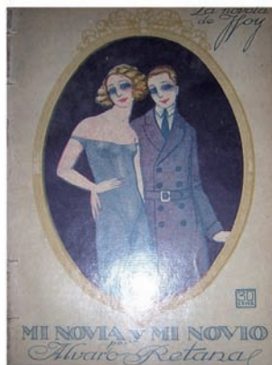
Fig. 4. Mi novia y mi novio de Álvaro Retana

A mediados de los felices veinte, Álvaro y sus máscaras habían publicado casi ochenta obras entre novelas, cuentos y libretos para espectáculos de varietés . Una monografía sobre la vida y la obra de La Chelito 4 (1930) [Fig. 2], Los extravíos de Tony (1919) [Fig. 3] –novela de iniciación con tintes autobiográficos que se comentará más adelante–, La carne de tablado (1918), Ninfas y sátiros (escenas pintorescas de Madrid de noche) (1918), El príncipe que quiso ser princesa (1920), El vicio de color de rosa (1920), La mala fama (1922), Mi novia y mi novio (1923) [Fig. 4] o la novela de costumbres aristocráticas Las locas de postín (1919) 5 son algunos de sus