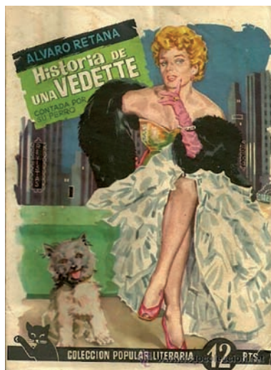
Fig. 5. Historia de una vedette contada por su perro.

Ante la acusación del fiscal de que usaba un copón bendito para beber semen de sus amantes, Retana hace gala de un aplomo y un sentido del humor que jamás le abandonaría y contesta: “Señor, prefiero siempre tomarlo directamente” 16 . Tras aplazar varias veces su ejecución, se le conmutó por treinta años de cárcel, de los que cumplió prácticamente una década; puesto en libertad y recuperado su empleo en el tribunal de cuentas en el año 1957, Álvaro continuó con sus múltiples actividades, que no había abandonado en prisión, e incluso vivió un pequeño renacer con el taquillazo de El último cuplé . También volvió a publicar ensayos sobre el género que tan bien dominaba como: Estrellas del cuplé o Estrellas del arte frívolo , además del ensayo Historia del arte frívolo y una novela de las que tanto gustaban en su juventud, como Historia de una vedette contada por su perro (1954) [Fig. 5], si bien en 1970, habiendo cambiado su más que saqueada mansión, por una humilde buhardilla en el madrileño barrio de San Bernardo, murió –cuentan que asesinado por un chulo– 17 , pero sobre