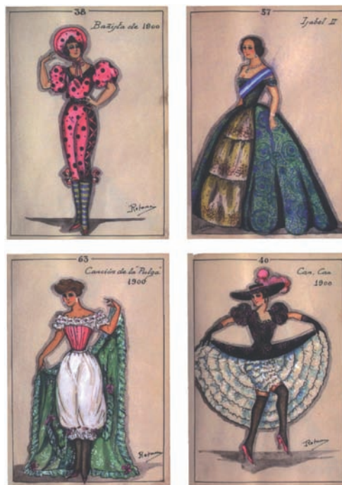
Fig. 11. Figurines de Álvaro Retana adquiridos por la BNE.