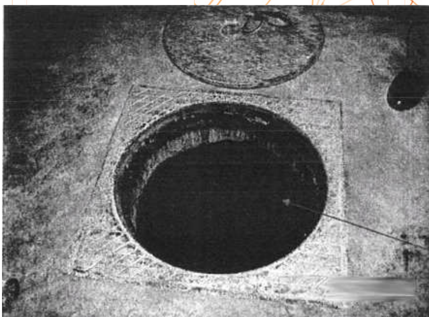
Foto 1. Boca de entrada al trujal donde ocurrió el accidente

Habían limpiado un trujal y se dispusieron a realizar la limpieza del segundo, y al iniciar dicha tarea se produjo el accidente.