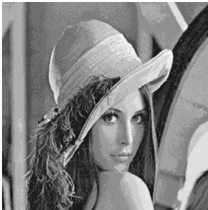
Imagen sin ruido

Ruido provocado durante el procesamiento de la imagen