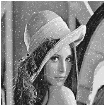
Imagen con 10 % de ruido exponencial

Ruido provocado durante el procesamiento de la imagen