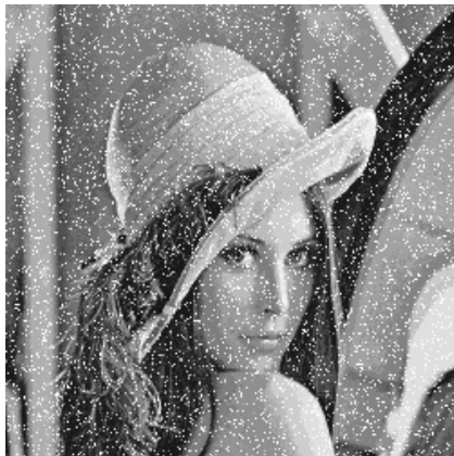
Imagen con un 10% de ruido gaussiano

Ruido provocado durante el procesamiento de la imagen