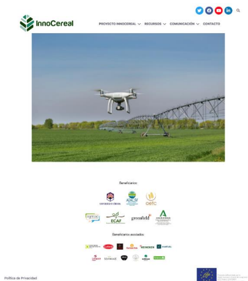
Figura 1: Captura de pantalla del sitio web LIFE Innocereal EU.