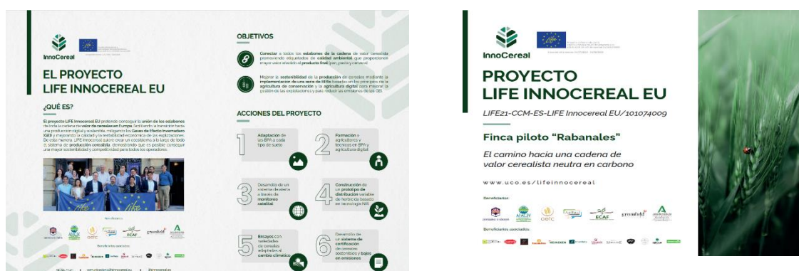
Figura 2. Derecha: Captura de pantalla del tablón de anuncios del proyecto.