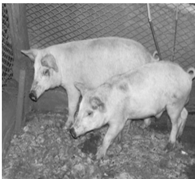
Figura 4. Lechones F1 en recría (CCC x Landrace). Verónica. Provincia de Buenos Aires (F1 in rearing piglets (CCC x Landrace). Veronica. Province of Buenos Aires).

( figura 4 ) perteneciente a una raza mejorada (generalmente Landrace, Yorkshire o Duroc Jersey). Otros productos generados, son los relacionados con la fabricación de distintos tipos de chacinados (jamones, chorizos etc.), que se caracterizan por su sabor particular y su bajo contenido de grasa, estos se hacen a partir de cerdos de 80 - 100 kg. de peso vivo, luego de concluir su etapa de engorde ( figura 5 ).