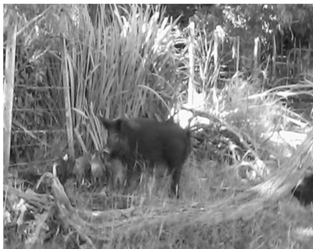
Figura 3. Cerda Criolla Costera en sistema de producción familiar con su primera camada. Las Tahonas Provincia de Buenos (Coastal Creole Sowin family production system with her first litter. The Tahonas. Province of Buenos Aires).

Otra característica favorable que observan los productores es que el CCC, está habituado al consumo de pastos, raíces y alimentos groseros, acostumbrándose rápidamente al consumo de distintos tipos de residuos o subproductos en general. Por otra parte también se observa que el volumen de alimento consumido por el CCC, es muy inferior al de las razas mejoradas, siendo ésta una condición fundamental para la subsistencia de los sistemas de producción familiares con mínima inversión. En general el producto final utilizado es el consumo del lechón, tanto en pureza ( figura 3 ), como el producto de la cruce de la madre CCC con un padrillo