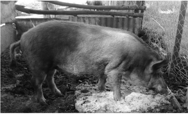
Figura 5. Capón Cerdo Criollo Costero en la etapa de engorde. Las Tahonas Provincia de Buenos (Coastal Creole pig fattening. The Tahonas. Province of Buenos Aires).